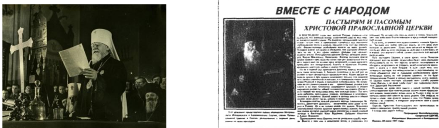
Рис. 2. Обращение Митрополита Московского и Коломенского Сергея (Страгородский) к православным мирянам от 22 июня 1941 года

Свою истинную позицию Русская Православная Церковь показала сразу же, в первые дни войны. Митрополит Московский и Коломенский Сергей (Страгородский) стал первым, кто 22 июня 1941 года, в день Всех Святых, в земле Российской просиявших, в воскресный день, в Богоявленском соборе, обратился к народу в Москве с обращением. Своё Послание он не только сумел написать в одночасье, но и разослать по всем уголкам нашей необъятной Родины в первый же день войны.