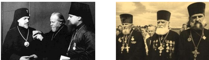
Рис. 1. Фотографии: слева – Митрополит Николай вручает государственные награды священнослужителям, медали «За оборону Москвы»; справа – награжденные служители Русской Православной Церкви за высокие заслуги перед Отечеством

В это тяжелое и судьбоносное для страны время, к высшему руководству Советской власти пришло понимание роли Русской Православной Церкви, её высокой исторической миссии в жизни русского народа, сохранении и развитии Руси-России, её возможности в защите страны от внешних напастей, коричневой чумы. Как показала дальнейшая история, роль Русской Православной Церкви была оценена Советским государством по достоинству, многие священнослужители были награждены высокими государственными наградами.