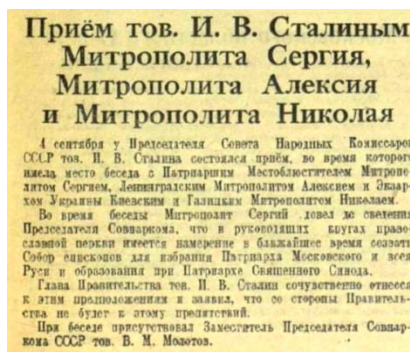
Рис. 4. Прием И.В. Сталиным Митрополита Сергея, Митрополита Алексия, Митрополита Николая 4 сентября 1943 года

Война, пробудила в русском (российском) человеке все лучшее, что было собрано историей его развития и становления, она заставила его забыть про воинствующий атеизм. И опять, как всегда это было на Руси-России, вместе с верой в Бога, храбро сражаться и умирать за своё Отечество. Многие эти факты, находят отражение на фотографиях военных лет, выражающих единство народа и Русской Православной Церкви в лихую годину.